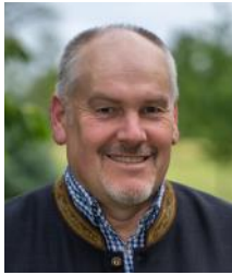
Bürgermeister Bernhard Öttl Fraham 3 ÖVP